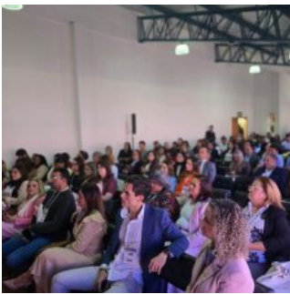
Gramado/RS recebe o Encontro Nacional de Gestores e Legislativos Municipais 22/10/2025