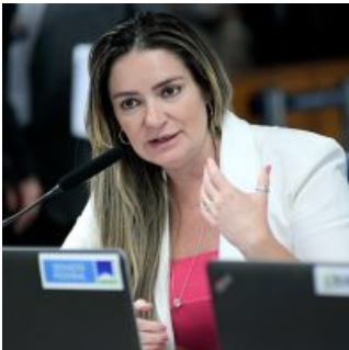
Senado lança ferramenta de combate à violência política de gênero 22/10/2025