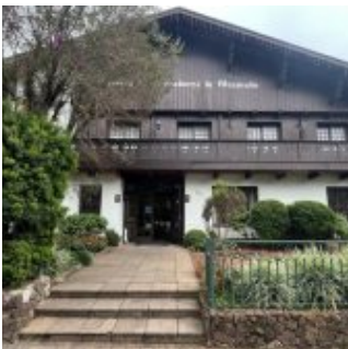
Câmara Municipal de Gramado/RS reforça seu papel de reconhecimento e compromisso com a cidade 21/10/2025