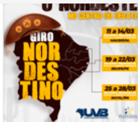
Giro Nordestino fortalece o Legislativo Municipal e prepara gestores para a XXXIV Marcha em Brasília Página 8